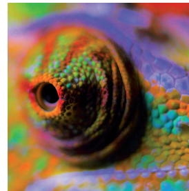
Deze afbeelding is gemaakt in een hoge resolutie (300 DPI).

Het open bestand dient te bestaan uit de definitieve opmaak, inclusief de eventuele geïmporteerde illustraties c.q. foto's (Bij voorkeur gekoppeld) en alle gebruikte lettertype (Ook voor de gebruikte ondersteunende grafische pakketten).